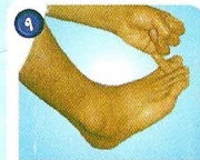
صفة تخليل أصابع الرجلين

المراجع: الموسوعة الفقهية الجزء الأول / الثمر المستطاب للألباني