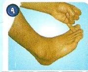
صفة تخليل أصابع الرجلين

المراجع: الموسوعة الفقهية الجزء الأول / الثمر المستطاب للألباني