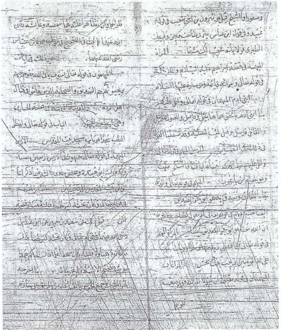
صورة اللوحة الثانية من كتاب (مواقع العلوم)